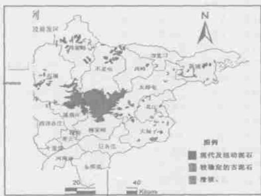
图 2 密云县重力灾害分布现状