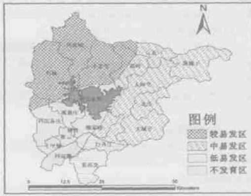
图 4 密云县地质灾害易发区划分