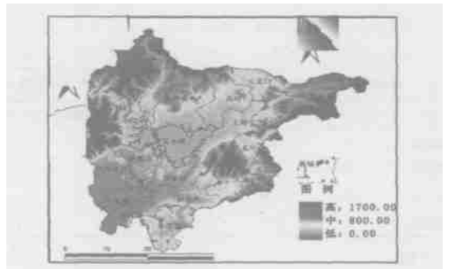
图 1 密云县地形地貌格局图

蒙古高原过渡地带, 属燕山山脉。东侧为雾灵山 (在密云部分海拔高度 1730 m), 西侧为云蒙山 (海拔高度在 1414 m)。东部、东南部和北部均为低中山区, 海拔多在 400~800 m 之间。密云水库位于中央, 海拔在 100~160 m。西南部为潮白河冲积洪积倾斜平原, 海拔 45~100 m。地势总体格局呈三面群山环绕, 中部低缓, 开口向西南的簸箕状 (图 1)。由于各地貌类型之间界线明显, 相对高差大, 沟谷切割深, 土层薄; 加上坡地较多, 洪旱频繁, 致使水土流失较为严重 [14] 。