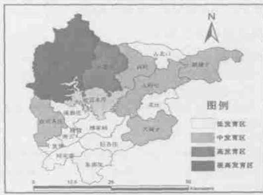
图 3 密云县重力灾害发育现状

(2)水文地质特征. 区内水文地质条件较为复杂. 山区地下水主要埋藏在基岩裂隙中,其次是山间河谷的第四系地层中,主要是裂隙水、岩溶裂隙水和孔隙水,含水层富裂隙不均,水位变化大. 碳酸岩类地层含水较为丰富,但水位低,开采困难,出露断层流量大. 第四系孔隙水多言河谷富水,风化裂隙水水量小,季节性变化强,不稳定. 平原地下水为第四系孔隙潜水,主要分布在地下 100 m 内. 含水层南厚北薄,与河水联系极为密切,埋深 3-20 m,由南向北,由深变浅. 地下水补给主要是自然降水,地表水渗入及农灌入渗. 平原还有山区侧向径流补给和密云水库补给 [14,15]